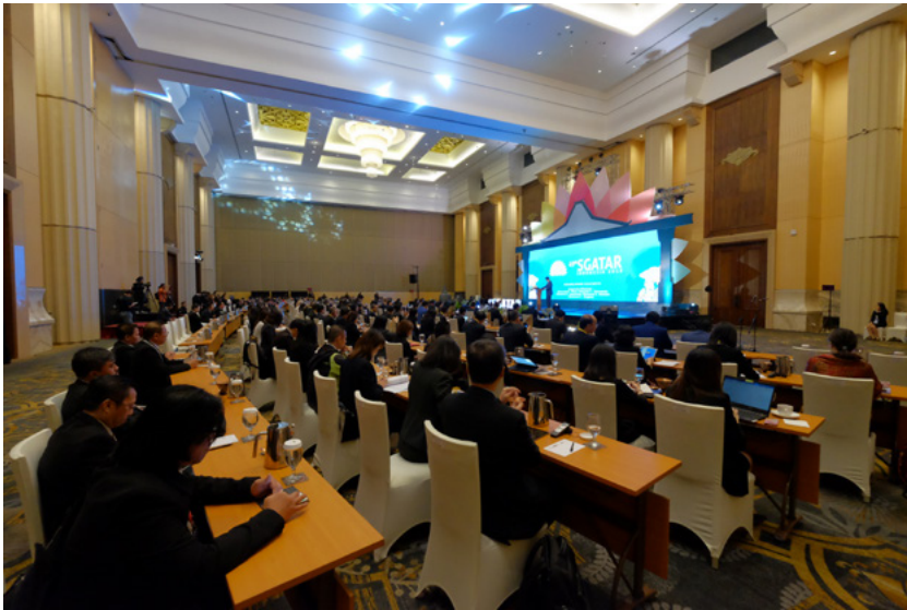
Para perwakilan dari 17 otoritas pajak di kawasan Asia-Pasifik dan 14 organisasi internasional menghadiri pertemuan SGATAR (Study Group on Asian Tax Administration and Research) ke-49 di Yogyakarta pada 23 Oktober 2019. Dalam pertemuan ini, tim kerja (working group) membahas tiga isu utama yakni transfer pricing, pertukaran informasi (Automatic Exchange of Information), dan simplikasi administrasi perpajakan.

Dukungan kepada DJP terus berlanjut hingga bergulirnya Reformasi Perpajakan Jilid III.