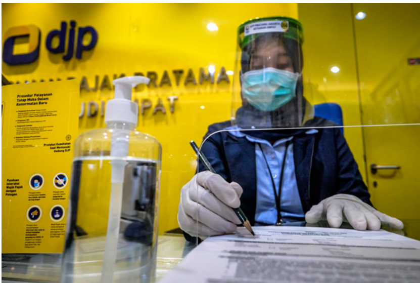
Petugas front office KPP Pratama Jakarta Setiabudi Empat memberikan layanan perpajakan secara tatap muka pada 8 Juli 2020. Di masa kenormalan baru, kantor pelayanan pajak di seluruh Indonesia menyiapkan sarana dan fasilitas kesehatan untuk mengantisipasi penyebaran Covid-19.