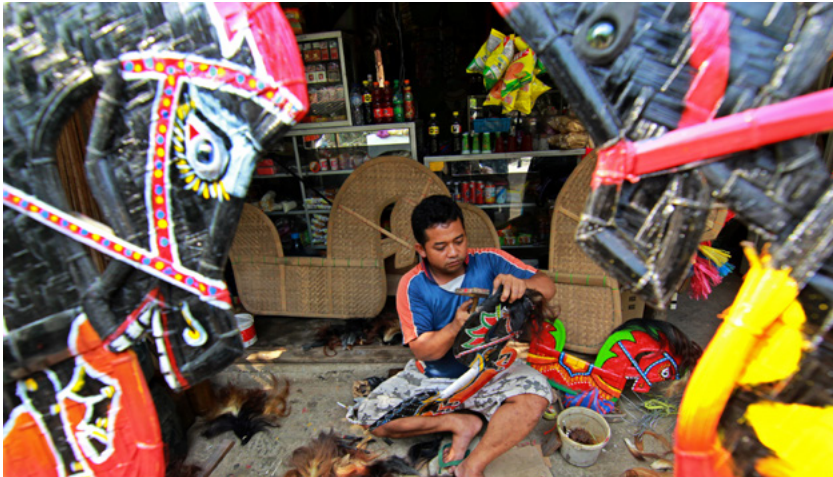
Perajin membuat kuda lumping berbahan bambu dan rambut kuda di Getasan, Kabupaten Semarang, Jawa Tengah. Produk kerajinan ini nantinya akan dipasok ke sentra penjualan kerajinan di sejumlah daerah di Jawa Tengah dan Daerah Istimewa Yogyakarta (DIY). Pada Maret 2020, kasus Covid-19 pertama kali dijumpai di Indonesia dan mulai memberikan dampak bagi sektor usaha dan perekonomian Indonesia. Untuk itu pemerintah merespons cepat dengan memberikan berbagai insentif dan fasilitas perpajakan guna menjaga kelangsungan usaha wajib pajak.

Dari situlah DJP paham betul bahwa masih banyak yang memang membutuhkan. “Oleh karena itu, di 2021 insentif ini kita teruskan. Karena saat ini ekonomi sedang naik. Banyak masukan dari berbagai pihak. Insentif fiskal ini untuk menstimulasi, untuk membantu cash flow perusahaan, meskipun tidak membebaskan pajaknya,” tutur Yon.